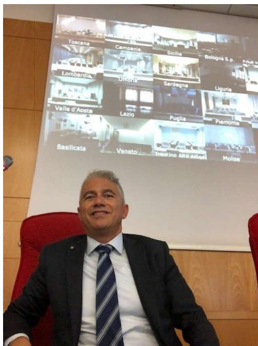
Foto 3 – INPS – Direzione Generale- Lezione in videoconferenza con le Direzioni Regionali in materia di appalti pubblici -2019

Durante il Dottorato di ricerca sono state svolte lezioni in materia di LL.PP. presso L'università Politecnica delle Marche – Facoltà di Ingegneria- Istituto IDAU ( Prof. Berardo Naticchia) e presso strutture esterne ( es. Banca di Italia –Roma Direzione Generale)