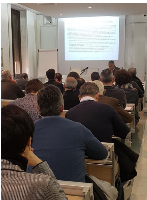
Foto 2 – Corso in materia di costi della sicurezza presso Ordine Ingegneri Teramo -2019