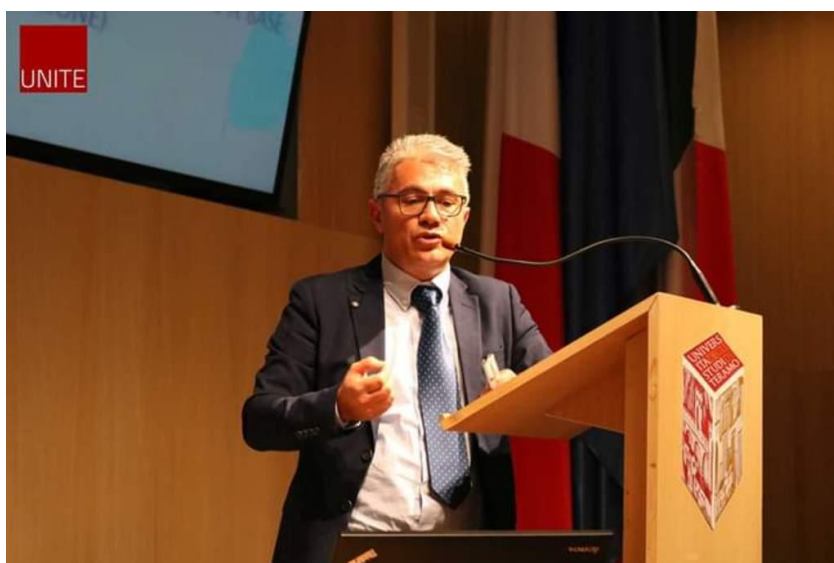
Foto 4 - Convegno Università di Teramo 14 marzo 2019 Seminario di studi - GLI APPALTI E I CONTRATTI PUBBLICI: STRUMENTO VIRTUOSO PER LO SVILUPPO ECONOMICO E SOCIALE DELL'ITALIA

Durante il Dottorato di ricerca sono state svolte lezioni in materia di LL.PP. presso L'università Politecnica delle Marche – Facoltà di Ingegneria- Istituto IDAU ( Prof. Berardo Naticchia) e presso strutture esterne ( es. Banca di Italia –Roma Direzione Generale)