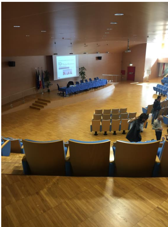
Foto 1 - Lezioni in materia di lavori pubblici presso la sede della Regione Friuli Venezia Giulia